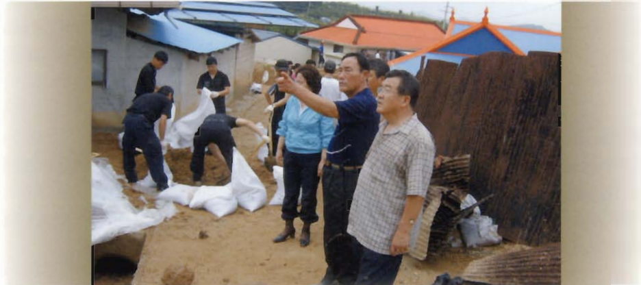
수해복구 현장 방문