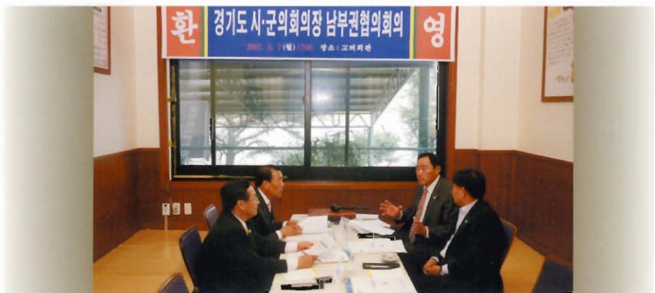
경기도 시·군의회 의장 남부권 협의회의