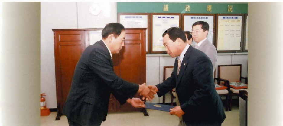
회계결산 감사 위촉식